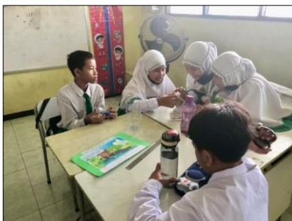
Figure 3. Membuat percobaan energi gerak “kincir air”

Model PBL memberikan pengaruh yang begitu besar terhadap tingkat pencapaian kemampuan HOTS siswa sekolah dasar. Karena dalam pembelajaran tersebut siswa diajarkan untuk selalu berpikir tingkat tinggi berdasarkan sintaks PBL. Pada fase pertama, siswa diajak untuk menentukan masalah pada suatu fenomena. Fase kedua, siswa diminta untuk menganalisis hasil pengamatannya. Fase ketiga, siswa membentuk kelompok diskusi untuk mengevaluasi percobaan. Fase keempat, dalam fase ini siswa diminta untuk mengkreasi karyanya kemudian mempresentasikan. Pada fase kelima atau terakhir, siswa diminta untuk menganalisis dan mengevaluasi proses penyelesaian masalah tersebut. Hal ini didukung oleh penelitian terdahulu yang menyatakan bahwa penerapan model PBL dapat meningkatkan kemampuan berpikir tingkat tinggi dengan baik (Nurbaya, 2021). HOTS dapat dilatihkan kepada siswa melalui model PBL, karena model pembelajaran ini dirancang untuk menuntut adanya aktivitas dan keterlibatan siswa secara penuh (Rosidah, 2018). Adapun dokumentasi selama proses penelitian, sebagai berikut: