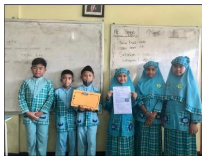
Figure 4. Membuat percobaan rangkaian listrik rangkaian