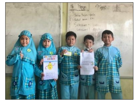
Figure 5. Membuat kreativitas poster hemat energi